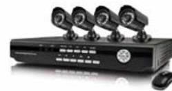
Thiết bị an ninh