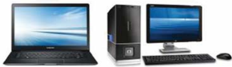
Thiết bị tin học