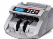
Máy đếm tiền